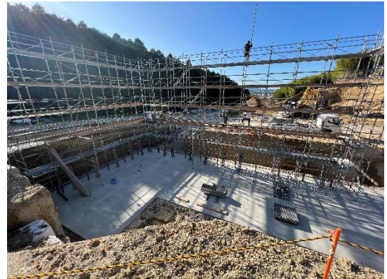
② 逆 T 型擁壁