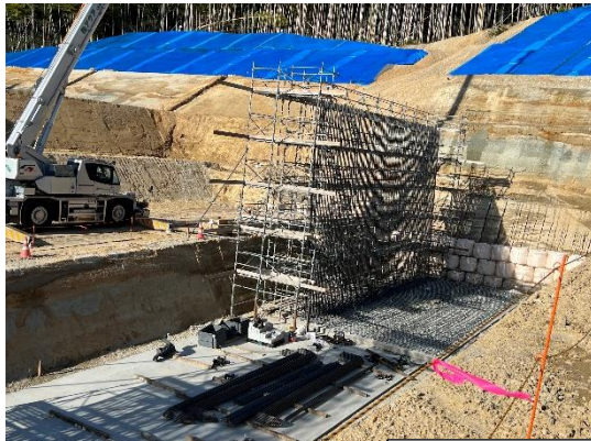
① L 型擁壁

10 月 6 日に配筋設置のため、均しコンクリートを行い、10 月 10 日より足場の組み立て、鉄筋の配置を行っています。